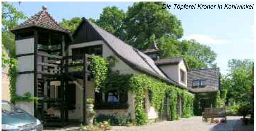
Die Töpferei Kröner in Kahlwinkel

Also, liebe Kollegen, überwindet alle Vorbehalte und macht mit. Eine solche bundesweite Werbung für nur 60,- Euro im Jahr ist einfach nicht zu toppen!