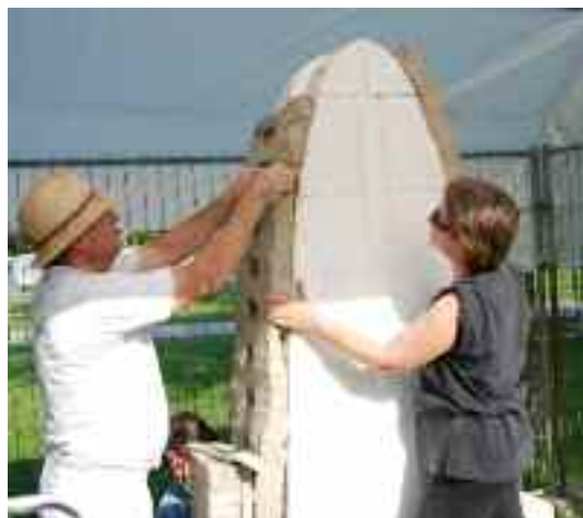
Bau der Feuerskulptur