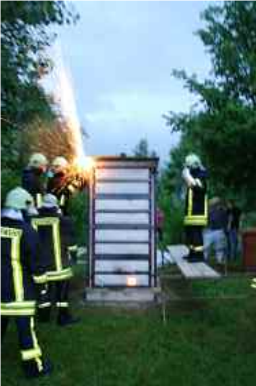
Öffnen der Feuerskulptur

Wie erwartet gut organisiert, wird das 5. Symposium seinen Eintrag in den lokalen Geschichtsbüchern finden. Es fand vom 18. bis 29.05. in dem das Olbersdorfer Wasser begleitenden Parkgürtel der Gemeinde statt. Ein wunderschönes Gelände mit abwechslungsreicher Struktur, welche verschiedene geologische Formationen erkennen lässt.